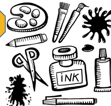
Nauki o sztuce Art studies