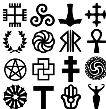
Nauki o kulturze i religii Culture and religion studies