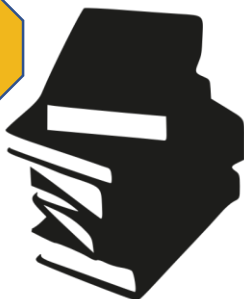
Literaturoznawstwo Literary studies